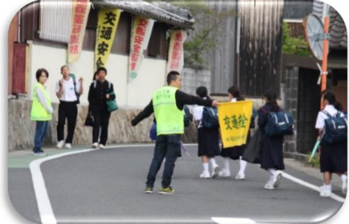
【バロー南の交差点での活動】