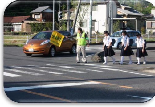
【山田の交差点での活動】