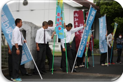
【高校生もあいさつ運動へ】