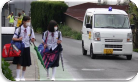
【青パトから地域への呼びかけ】

5月14日・15日にPTA母親委員が中心となり「あいさつ運動」が行われました。この活動は、生徒会はもちろんのこと、近隣の高校生、町ぐるみ防犯運動実行委員会など、多くの人の協力を得て実施しています。参加していただいたPTAの方からは「多くの生徒が挨拶をしっかりとしてくれすばらしかった。」というご意見もいただきました。次回は10月1・2日を予定しています。よろしくお願いします。